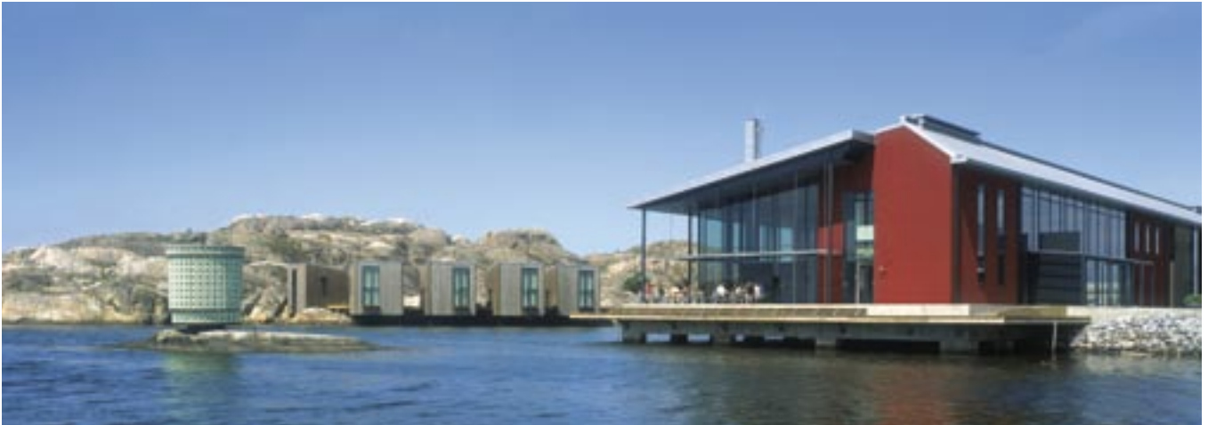
Nordiska akvarellmuseet.

Medlemsblad för Vänföreningen Nordiska Akvarellmuseet, maj 2007