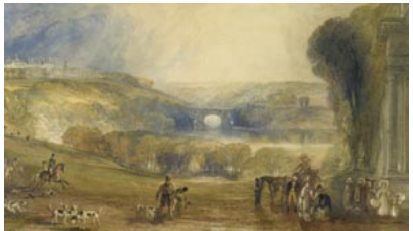
J.M.W. Turner (1775-1851) Blenheim Park and House, Oxfordshire, ca. 1832