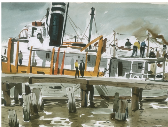
Dong Kingman 1911–2000, Hamn , 1937. Akvarell och blyerts på papper

Utställningens tyngdpunkt är konst från norra Kalifornien (San Francisco-bukten, Carmel, Sacramento och Eureka) men även södra Kalifornien är representerat med ett antal större mästerverk. Akvarelltekniken är självklart i centrum, men utställningen presenterar också andra tekniker, speciellt inom samtidskonsten. Utställningen delas upp i tre delar: Den första behandlar det tidiga 1900-talets Arts and Crafts-rörelse-, tidig modernism, statens (FAP) och arbetsmarknadsmyndighetens (WPA) konstsatsningar samt konst från andra världskriget. Andra delen fokuserar på efterkrigstidens surrealistiska abstraktion, det figurativa måleriet och popkonsten, samt den tredje och sista