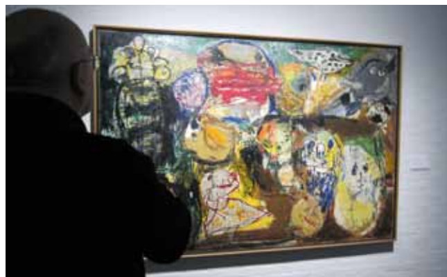
En av vännerna beundrar Asger Jörns Brev till min son (1956-57).