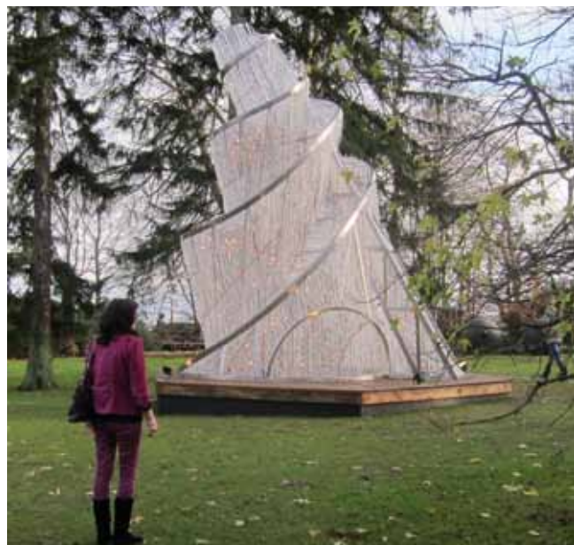
En vän tillsammans med Ai Weiweis Fountain of Light.

På konstmuseet Louisiana såg vi först konstverk av världens kanske just nu mest omtalade konstnär, den kinesiske regimkritikern Ai Weiwei. I museets park hade man byggt upp hans 7 meter höga Fountain of Light från 2007, utsmyckad med tusentals kristallkolor påminnande om en gigantisk "chandelier". Egentligen är den en parafra på den sovjetiske arkitekten Vladimir Tatlins utopiska torn, som var tänkt att byggas till den tredje kommunistiska internationalen 1920. Det uppfördes aldrig. Det som skulle ha blivit en symbol för kommunismens triumf kunde aldrig förverkligas i praktiken och Ais verk sammanfattar detta som en vacker illuminerad vanföreställning. Maktkriti-