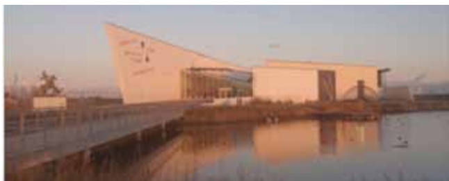
Moderna museet Arken, Köpenhamn dec 2019

För ett år sedan gick den traditionella julresan till bl.a till Museet Arken och Picassoutställningen där. Tyvärr blev det ingen julresa i år. Vi får leva på de fina minnen som finns från Julresan 2019 och hoppas på att få återuppta denna tradition 2021.