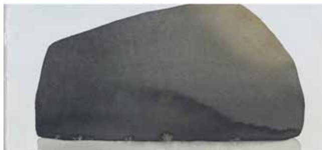
Mats Gustafson, utsnitt ur verket Sten 31 , 2002. ©Konstnären