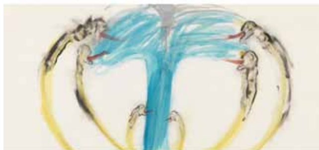
Nancy Spero, utsnitt ur verket Bomb, Dove and Victims , 1967. ©The Nancy Spero and Leon Golub Foundation for the Arts