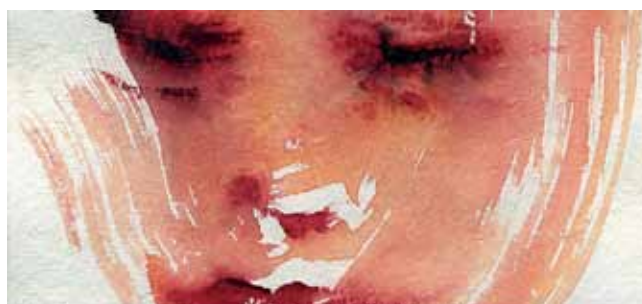
Leiko Ikemura, utsnitt ur verket Self, 2008.

Året på museet följer därefter med ytterligare två separatutställningar. Under sommaren visas för andra gången konstnären Mats Gustafson och hösten tar vid med en utställning med den amerikanska konstnären Nancy Spero.