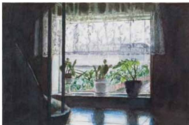
Kristinn G. Harðarson, Untitled 2002 Akvarell på papper 28 x 37,5 cm © Konstnären/Nordiska Akvarellmuseet

Vardagen har inspirerat konstnärer så långt vi känner till. I utställningen möter vi konstnärer vars verk ger en inblick i det som kan sammanfattas som livets dagliga flöde. De skänker oss glimtar av vardagar och berättar om öden och erfarenheter som ibland liknar och ibland helt skiljer sig från våra egna. Deras konst är fri från stora gester och fångar istället det som tyst passerar förbi.