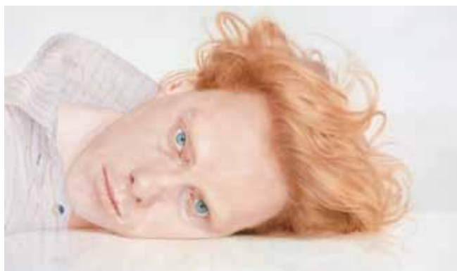
Maria Nordin, On Display, 2018 Akvarell på papper 148 x 212 cm.

Akvarellens rikliga flöden är Maria Nordins rätta element. Hon väljer gärna stora format, flödande färger och distinkt applicerade valörer. De mest kända verken är närgångna skildringar av människogestalter svepta i rosa färgtoner. Bakgrunden brukar vara avskalad. Kropparna verkar utslängda i en tom rymd och fångas mitt i en rörelse. Ansiktsporträtten är ofta kraftfullt beskurna. I Nordins bilder finns både sprödhed och bestämdhet, både precision och frihet. Det behagliga och det obehagliga ingår på jämbördiga villkor i ett särpräglat formspråk som söker sig mot det mystiska och där kroppen blir ett känslolandskap. I den omfattande separatutställningen på Nordiska Akvarellmuseet presenteras för första gången konstnärens allra senaste akvareller, såväl som ett rikt urval av äldre målningar och animationer, både från museets samling och inlånade.