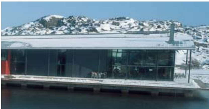
Nordiska Akvarellmuseet från Bockbolmen.

Information från Vänföreningen Nordiska Akvarellmuseet, februari 2006