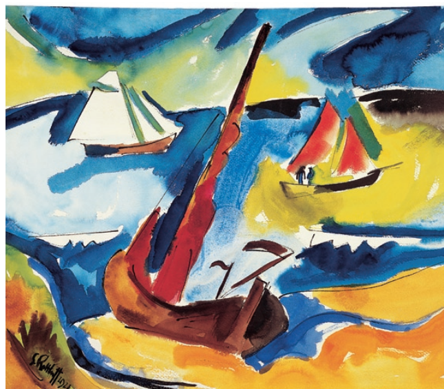
Karl Schmidt-Rottluff, Fiskebåtar på Östersjön, 1922, bilden är beskuren.