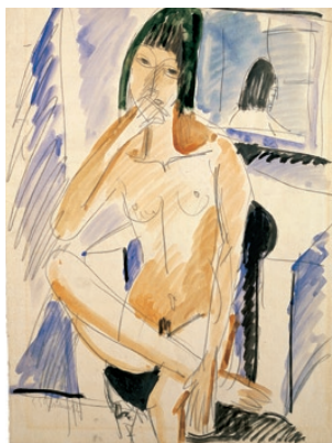
Ernst Ludwig Kirchner Sittande modell i blå fätölj, 1913