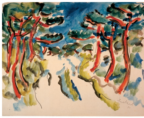
Erich Heckel Väg genom dynlandskap, 1911