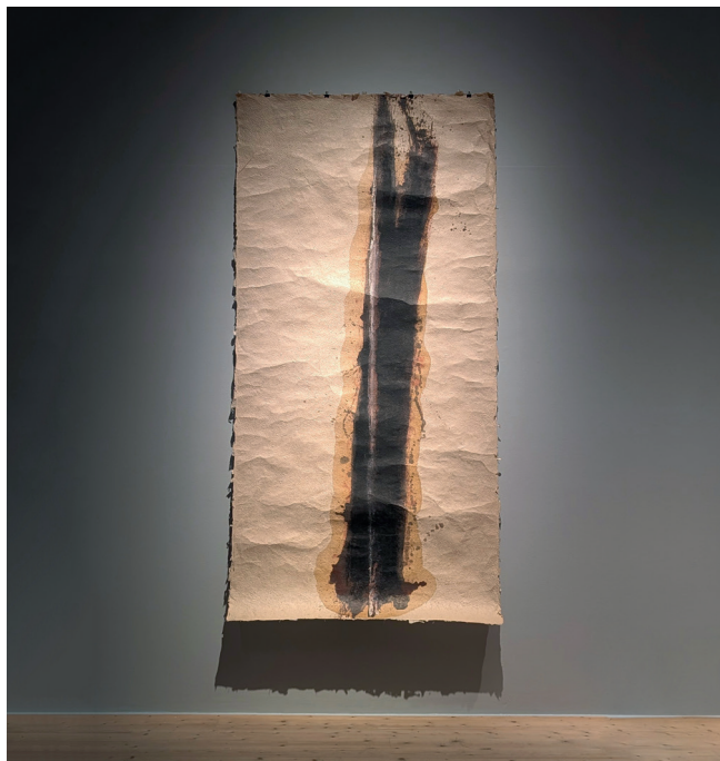
Claes Hake, Ett streck , 2001

”Papper. Jag är pappersfreak. Det här arket kommer från ett handpappersbruk i Nepal. Materialet, det enklast tänkbara – pigment, kol, jordfärger. Som bindemedel, torkade bladlöss (koschenill) upplösta i sprit.”