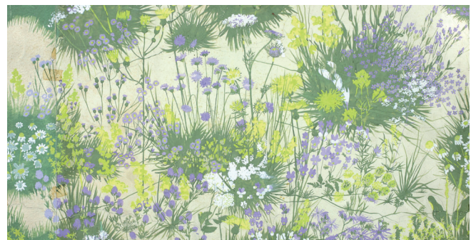
Arne Jacobsen, Skiss till mönstret Ången